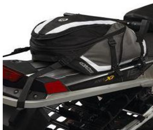
Sac étanche 35 litres