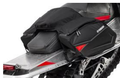
Sacoches 2 X 20L