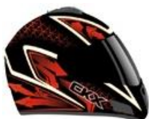
Casque intégral (Avec visière chauffante)

Moteur 4 temps 3 cyl / 135hp Vitesse maxi 155km/H Siège chauffant Accélérateur et poignées chauffantes Démarreur électrique Marche arrière