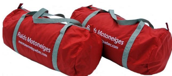
Sacs baluchon 2 X 15L