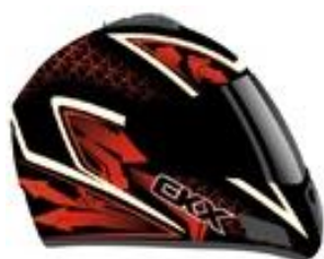
Casque intégral (Avec visière chauffante)

Moteur 4 temps 3 cyl /135hp Vitesse maxi 155km/H Siège chauffant Accélérateur et poignées chauffantes Démarrateur électrique Marche arrière