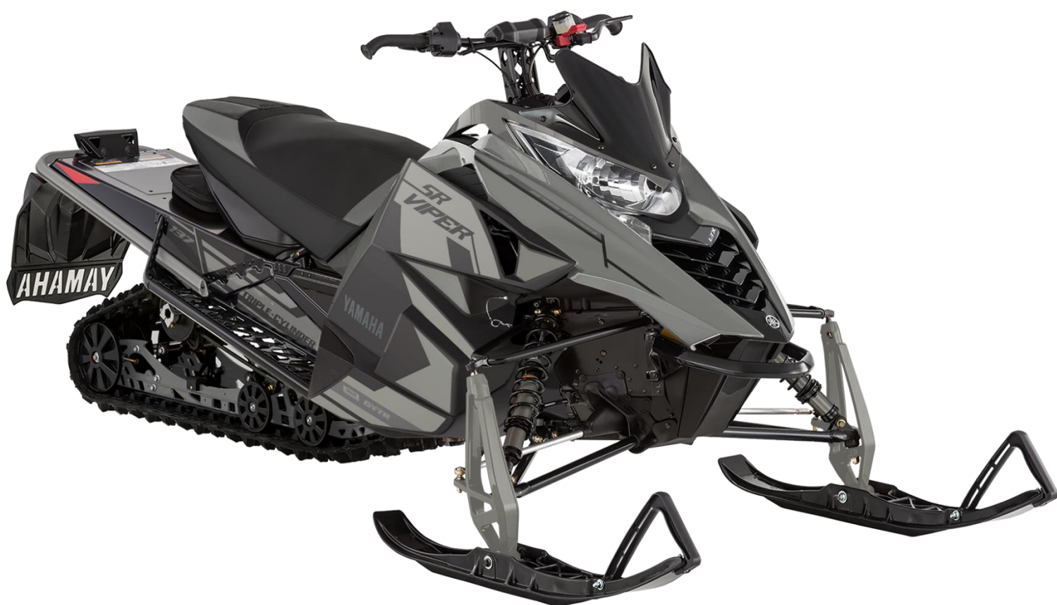
Yamaha SR Viper - 4 temps - 1049cc /135hp - modèle 2019 (sans odeur d'huile) (La couleur du modèle peut différer de celle illustrée)

Que vous soyez débutant ou expert, cette nouvelle Yamaha, sportive et légère, est conçue pour la piste et le semi hors-piste