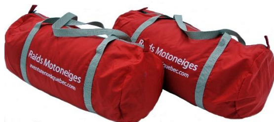
Sacs baluchon 2 X 15L